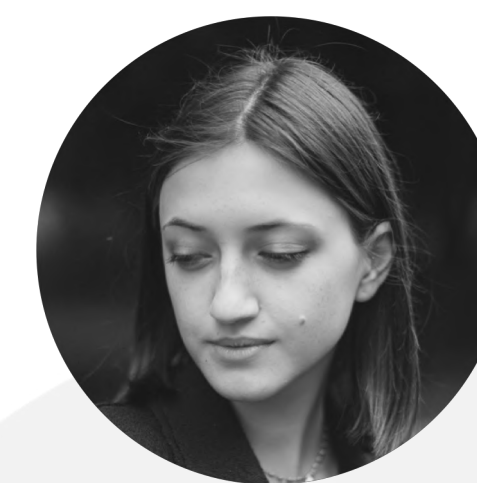
Специалист по реагированию