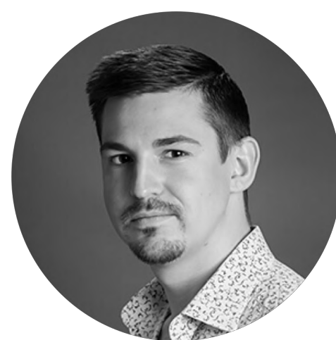
Специалист по мониторингу